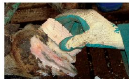
PASSO 8 Přiložte špalík.