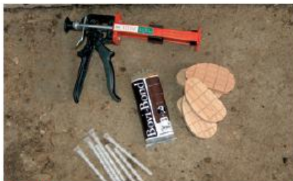
PASSO 1 Postup je následující.