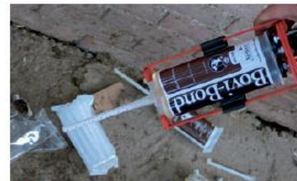
PASSO 4 Připevňte aplikátor.