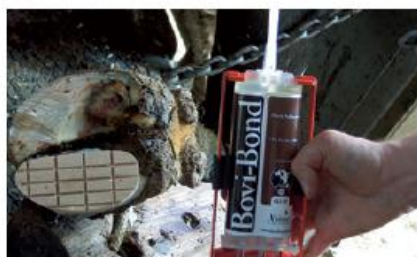
PASSO 10 Držte pevně po 2 - 3 minutách.