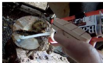
PASSO 7 Naneste materiál na špalík.