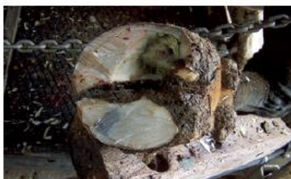
PASSO 5 Očistěte pazneht.