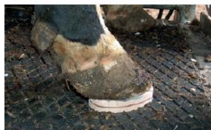
PASSO 11 Hotovo.