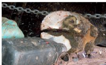
PASSO 6 Pazneht řádně osušte.