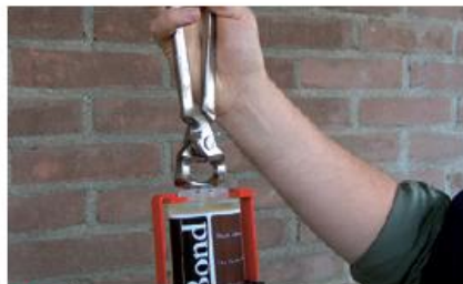
PASSO 2 Přichyťte kleště na „ramena“ náplně a odštipněte.