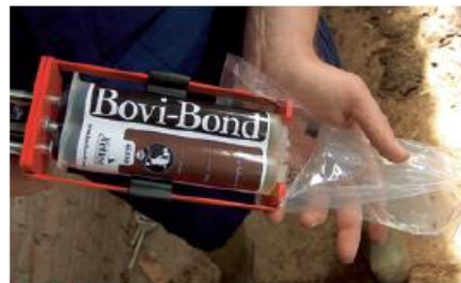
PASSO 3 Vytlačte materiál, abyste se ujistili, že vytéká z obou zásobníků.