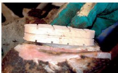
PASSO 9 Přidržte špalík po dobu 30 sekund. Mezi špalíkem a paznehtem musí být vrstva lepidla Bovi-Bond o tloušťce zhruba 3 mm.